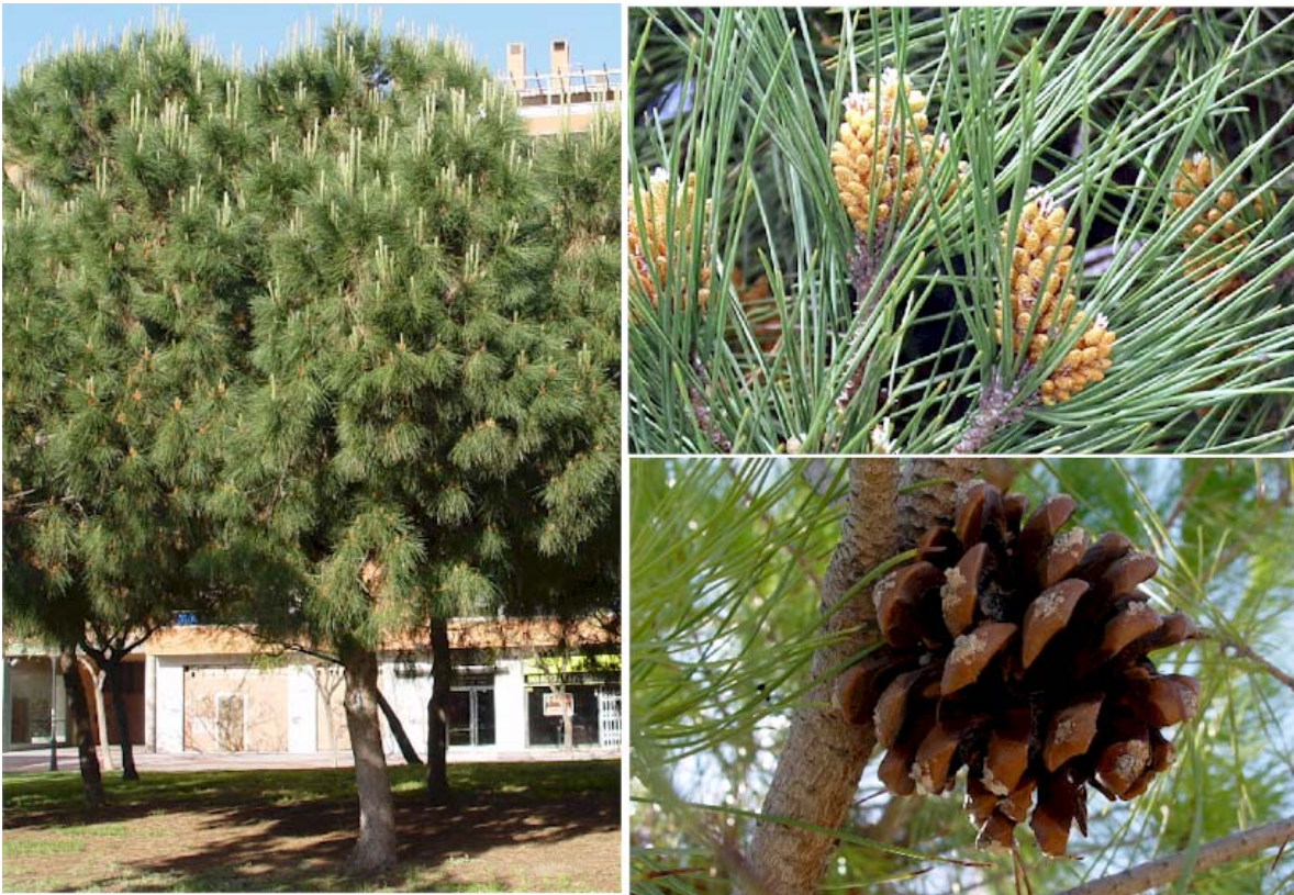
Aspecto general con flores en Abril y detalle de inflorescencias masculinas en Mayo y cono abierto en Noviembre