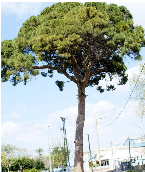
Pino piñonero de Churra

con ombligos poco prominentes. Piñones gruesos, de 15-20 x 7-9 mm, con una cubierta muy dura recubierta de un polvillo oscuro y un ala muy corta que cae pronto. Almendra harinosa y resinosa, comestible.