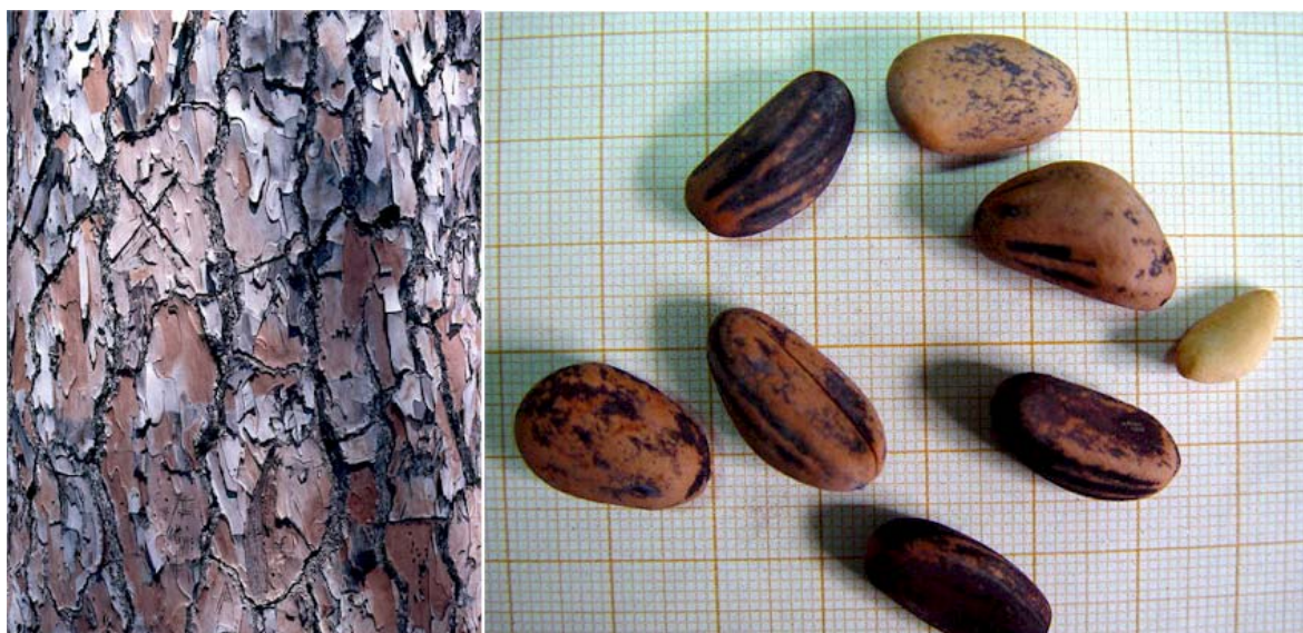
Detalle de la corteza del tronco y de las semillas (piñones). A la derecha un piñón sin su cubierta

Localización: Especie muy frecuente en parques y jardines de Murcia y de Pedanías, en muy pocas ocasiones formando alineaciones en calles. Podemos observar un buen ejemplar en el Jardín del Palmeral, en la Avenida Primero de Mayo. En Churra quedan